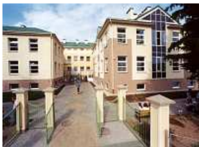
Gimnazjum w Tyczynie

Placówkami organizującymi życie kulturalne mieszkańców gminy są: Miejsko-Gminny Ośrodek Kultury, domy ludowe działające we wszystkich miejscowościach oraz 5 placówek bibliotecznych znajdujących się w Tyczynie, Borku Starym, Budziwoju, Hermanowej i Kielnarowej. Opieka medyczna działa w dwóch sektorach: publicznym i prywatnym, oferując mieszkańcom usługi z zakresu podstawowej opieki medycznej wraz z diagnostyką w Przychodni Rejonowej i Centrum Medycznym MEDI COR w Tyczynie oraz dwóch ośrodkach zdrowia - w Borku Starym i Budziwoju. Działalność placówek służby zdrowia uzupełniają: Stacja Opieki Caritas Diecezji Rzeszowskiej, Świetlica Dziennego Centrum Gminnej Aktywności oraz 4 apteki - dwie w Tyczynie oraz po jednej w Budziwoju i Borku Starym.