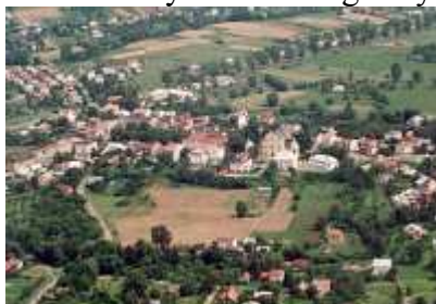
Panorama Tyczyna

Powierzchnia gminy wynosi 82,44 km 2 ; miasto Tyczyn usytuowane w centrum gminy zajmuje obszar 9,67 km 2 . Według danych Urzędu Statystycznego w Rzeszowie z 2002 r., użytki rolne zajmują 76,2% powierzchni, z czego 70,6% przypada na grunty orne, 16,9% na łąki, 7,9% na pastwiska, a 4,6% na sady. Lasy i grunty leśne pokrywające 14% ogólnej powierzchni gminy wchodzi w skład dwóch większych kompleksów leśnych znajdujących się przy południowej granicy gminy, na terenie Hermanowej Przylasku i Czerwonek Kielnarowskich oraz mniejszych - na wzgórzach otaczających Matysówkę i Borek Stary. Pozostałe grunty i nieużytki zajmują 9,8% powierzchni. Większość gruntów